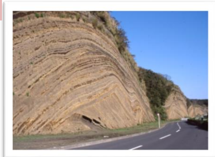
地層切断面 イメージ