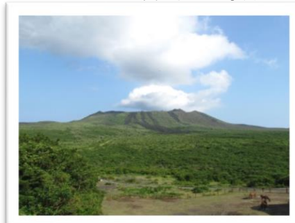
三原山頂口 イメージ

国内旅行条件(要約) 詳しい旅行条件を説明した書面(旅行条件書)をお渡ししますので事前にご確認の上お申込み下さい。